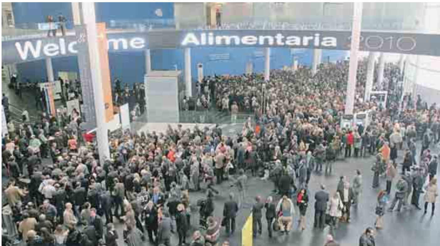
Panorámica de la entrada de la feria Alimentaria ayer en Barcelona. LUIS MORENO