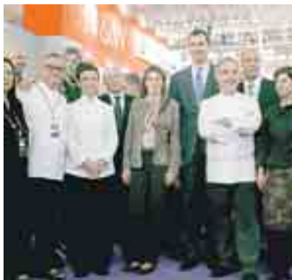
Los Príncipes Felipe y Leticia inauguraron ayer oficialmente la feria (izda) y expositor cortando jamón (dcha).