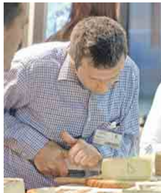
El salón presenta la mayor oferta gastronómica de España. LUIS MORENO