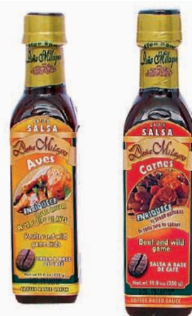
SALSAS DE CAFÉ ▶ Doña Milagro comercializa salsas elaboradas a base de café, compuestas con especias como pimentón, laurel y orégano; para carne, pescado, barbacoa y aves.