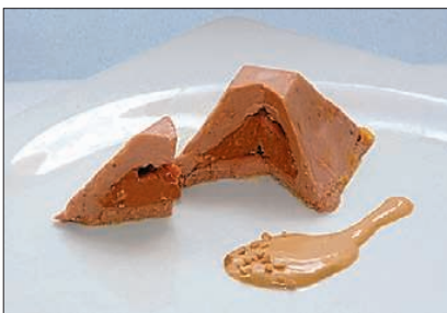
FUAGRÁS DE TURRÓN DE JIJONA ▶ Mas Parés combina fuagrás de pato y crema de turrón de Jijona en un producto ideal como aperitivo o entrante.