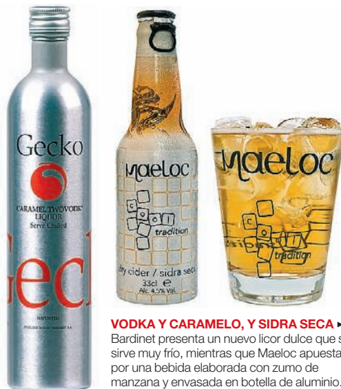
VODKA Y CARAMELO, Y SIDRA SECA ▶ Bardinet presenta un nuevo licor dulce que se sirve muy frío, mientras que Maeloc apuesta por una bebida elaborada con zumo de manzana y envasada en botella de aluminio.

Según la Fundación Triptolemos, Madrid, Andalucía y Catalunya son las comunidades que concentran un mayor número de proyectos de investigación. La industria cárnica lidera los estudios.