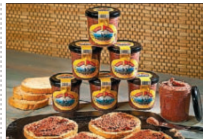
CREMA DE CECINA ▶ Cecinas Pueblo quiere fomentar el conocimiento del producto poniendo a la venta cecina de vacuno para untar en tarros de cristal.