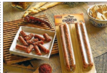
BARRITAS DE CHORIZO Y FUET ▶ España apuesta por el chorizo (150 gramos) y el fuet (130 gr) en envase fraccionable para vender en los súper.